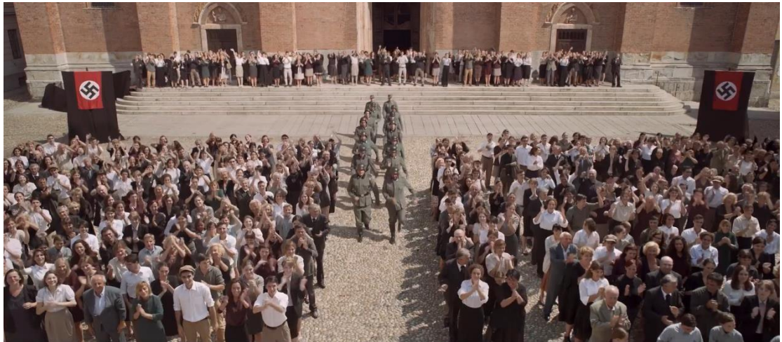
Figura 8, scena parata nazista.

La cripta di St. Eusebio 33 vede molte scene che interessano la clandestinità delle AR e quindi vede come protagonisti gli scout; essa diventa la cripta di San Sepolcro ovvero la base operativa di Milano delle Aquile Randagie, dove possono vivere in segreto i loro valori e continuare a svolgere le loro attività (vedi figura 7).