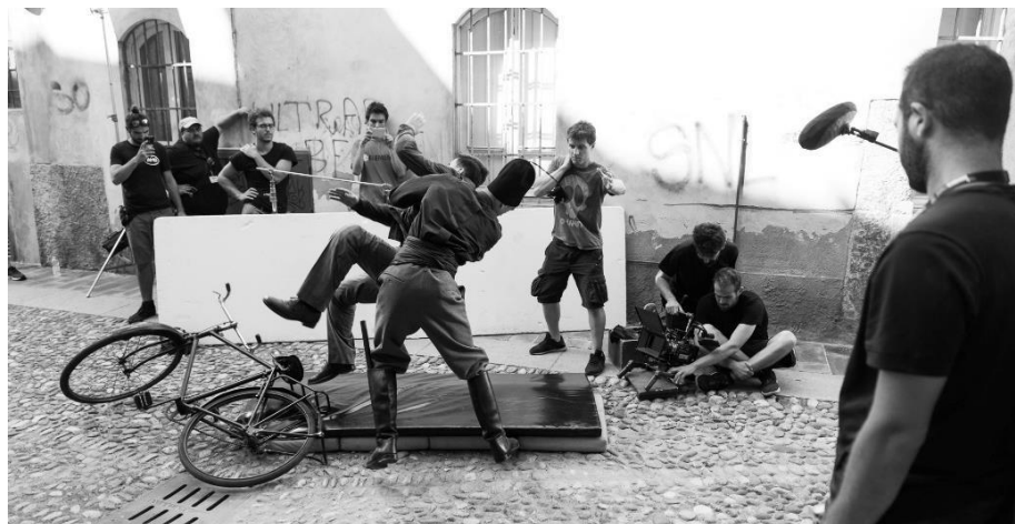
Figura 13, dietro le quinte della scena del pestaggio.

La scena del pestaggio di Kelly, girata in una via di Pavia, coreograficamente è un combattimento grezzo di strada; questo deve rispecchiare i personaggi, i caratteri, i rapporti di potere tra le persone dove si deve capire chi è il leader del branco anche tra chi aggredisce. La scena vede due/tre camicie nere appostate dietro l'angolo che aspettano di aggredire il ragazzo, il quale sta arrivando in bicicletta; questi lo afferrano e lo iniziano a picchiare e a sfogarsi contro.