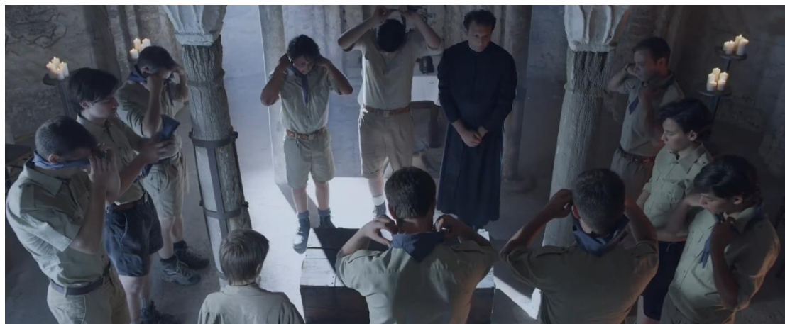
Figura 7, una delle scene nella cripta di St. Eusebio qui Kelly decide di istituire le AR.

La maggior parte del set del film è stato per tre settimane ad agosto situato a Pavia: tra piazza Botta, la cripta di St. Eusebio, il Bosco Grande, il collegio Ghislieri e la piazza del Carmine. La scelta della città di Pavia è data dal fatto che è una città storicamente legata alla storia della Lombardia e alla lotta partigiana, ma anche gli stessi luoghi sono veramente idonei e perfetti. Soprattutto perché Pavia offre la possibilità di essere esteticamente più accurata e di ricreare al meglio scorci, piazze, vie e anche interni nel modo più fedele possibile a quello che erano in quegli anni e quindi di dar un tocco estetico maggiore al progetto del film. Inoltre, perché Pavia è una città che la resistenza l'ha vissuta tanto da essere premiata con la medaglia d'argento alla resistenza; risulta dunque essere interessante il connubio fra il film che parla di coraggio e resistenza con questa città. 32