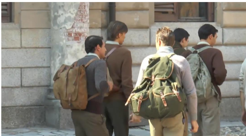
Figura 11, i ragazzi si incamminano per prendere il pullman che li porta in Val Codera.

L'altra piazza di Pavia interessata alle riprese è piazza Botta. Qui è stata girata una scena un po' particolare, i ragazzi che stanno diventando grandi continuano le loro uscite in Val Codera e mentre stanno andando a prendere il pullman si rendono conto che qualcuno ha imbrattato tutti i cartelli di propaganda fascista con delle frasi contro il regime.