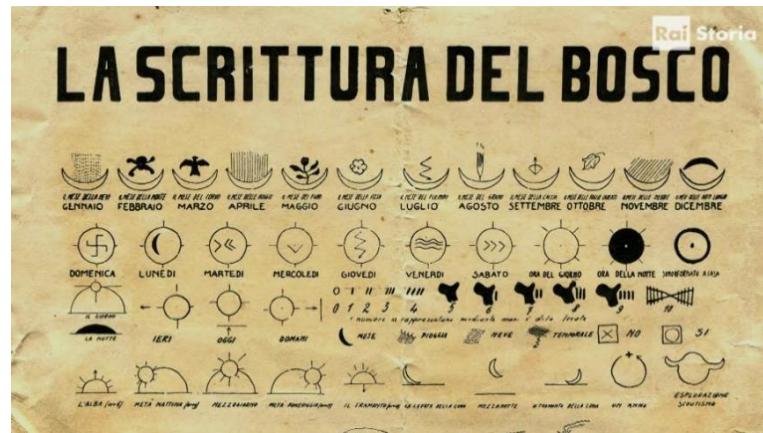
Figura 3, scrittura del bosco utilizzata dalle Aquile Randagie. 13

brevi messaggi cifrati. Messaggi che vengono scritti attraverso l'utilizzo del codice morse che gli scout nei loro giochi utilizzano frequentemente per la comunicazione ed il linguaggio del bosco (vedi figura 3).