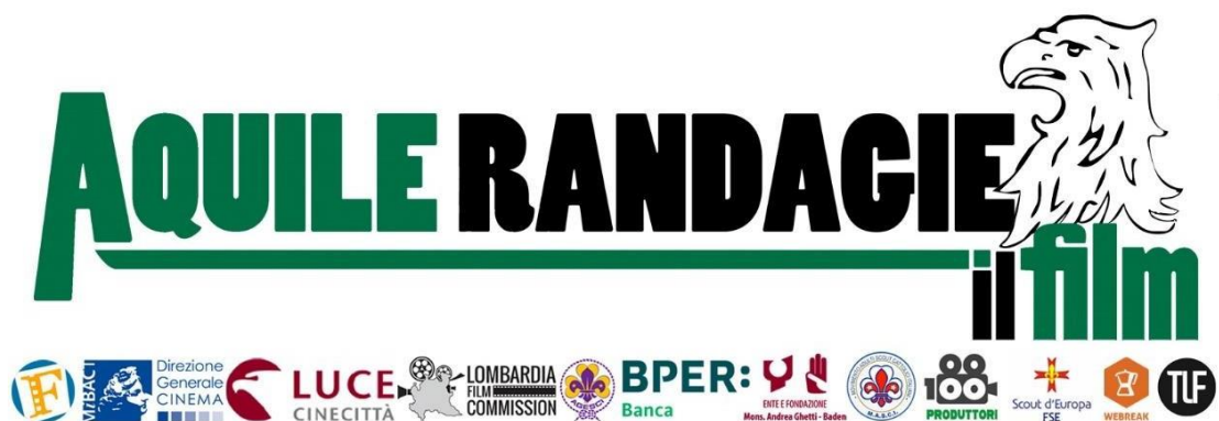
Figura 5, titolo del film con i loghi delle varie collaborazioni.