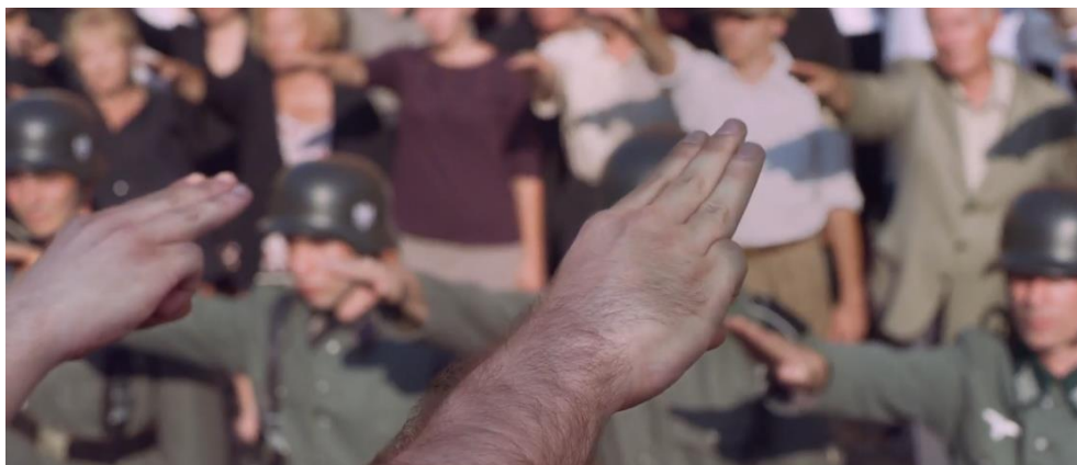
Figura 10, saluto scout sul palco della parata.

dimostriamo che non vi abbiamo dato mai retta e continueremo a non farlo. 36