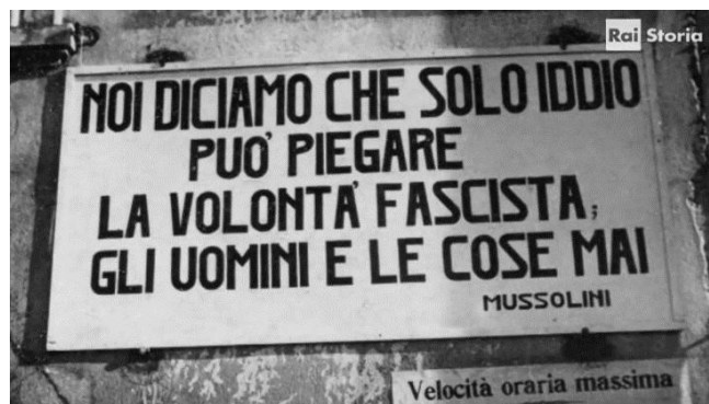
Figura 1, cartello che compare ad ogni stazione. 6

la volontà fascista, gli uomini e le cose mai - Benito Mussolini. (vedi figura 1.)